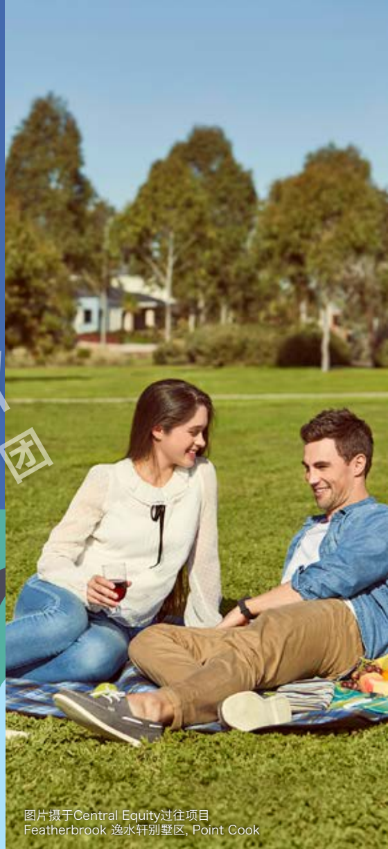
图片摄于Central Equity过往项目 Featherbrook 逸水轩别墅区, Point Cook